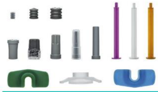
Verschlüsse und Zubehör