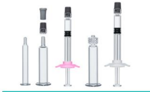
Gx® Luerlock Spritzen